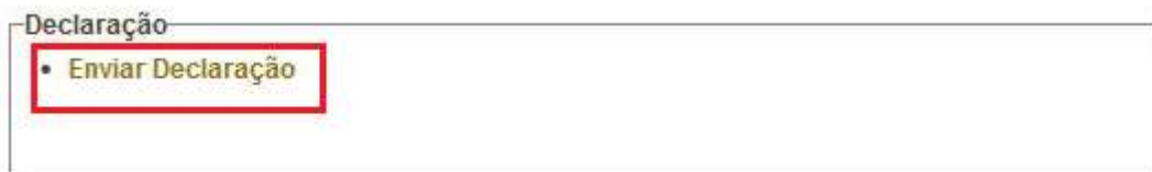
Figura 4: Tela de Envio Declaração no FEC