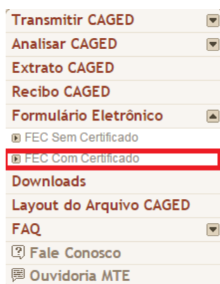
Figura 3: Menu Lateral do Portal CAGED

1. No menu lateral à esquerda, expanda a opção “Formulário Eletrônico” e, em seguida, selecione a opção “FEC Com Certificado” (Figura 3).