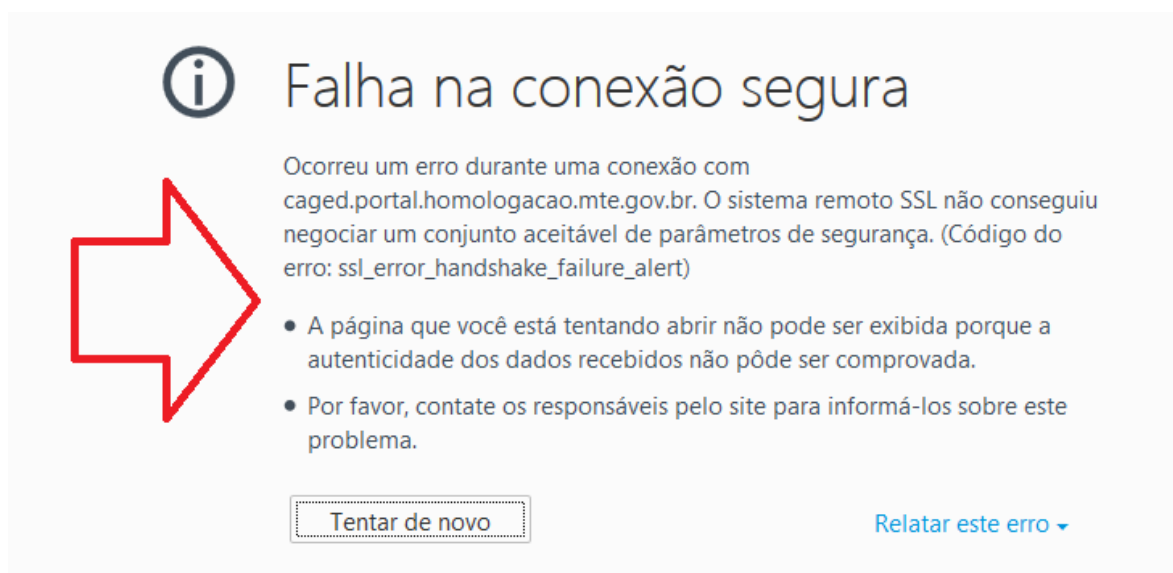
Figura 2: Mensagem de Erro apresentada no Firefox